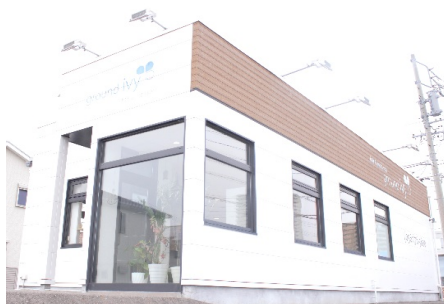
グラウンドアイビー (日進米野木支店)